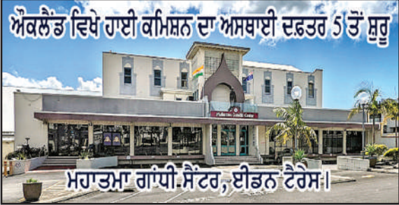
ਔਕਲੈਂਡ ਵਿਖੇ ਹਾਈ ਕਮਿਸ਼ਨ ਦਾ ਅਸਥਾਈ ਦਫ਼ਤਰ 5 ਤੋਂ ਸ਼ੁਰੂ

ਔਕਲੈਂਡ, (ਹਰਜਿੰਦਰ ਸਿੰਘ ਬਸਿਆਲਾ)- 5 ਸਤੰਬਰ ਨੂੰ ਭਾਰਤ ਦੇ ਵਿਚ ਅਧਿਆਪਕ ਦਿਵਸ ਮਨਾਇਆ ਜਾਂਦਾ ਹੈ ਅਤੇ ਔਕਲੈਂਡ ਵਾਲਿਆਂ ਦੇ ਲਈ ਵੀ ਇਹ ਦਿਨ ਇਤਿਹਾਸਕ ਹੋਣ ਜਾ ਰਿਹਾ ਹੈ। ਵੀਰਵਾਰ 5 ਸਤੰਬਰ ਨੂੰ ਮਹਾਤਮਾ ਗਾਂਧੀ ਸੈਂਟਰ ਵਿਖੇ ਭਾਰਤੀ ਹਾਈ ਕਮਿਸ਼ਨ ਦਾ ਦੂਜਾ ਦਫ਼ਤਰ ਖੁੱਲ੍ਹਣ ਜਾ ਰਿਹਾ ਹੈ। ਸ਼ੁਰੂ ਦੇ ਵਿਚ ਇਹ ਅਸਥਾਈ ਤੌਰ ਉੱਤੇ ਸ਼ੁਰੂ ਕੀਤਾ ਜਾ ਰਿਹਾ ਹੈ। ਇਥੇ ਪਾਸਪੋਰਟ ਅਤੇ ਓ. ਸੀ। ਆਈ ਵਾਲੀਆਂ ਸਹੂਲਤਾਂ ਉਪਲਬਧ ਹੋਣਗੀਆਂ। ਸਵੇਰੇ 9.30 ਤੋਂ 1 ਵਜੇ ਤੱਕ ਅਰਜ਼ੀਆਂ ਲੈਣਗੇ ਅਤੇ ਸ਼ਾਮ 4 ਤੋਂ 5 ਵਜੇ ਤੱਕ ਪਾਸਪੋਰਟ ਜਾਂ ਹੋਰ ਕਾਗਜ਼ ਵਾਪਿਸ ਦਿਆ ਕਰਨਗੇ